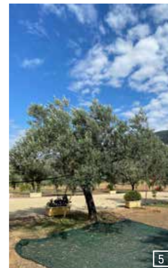
1) Mystras, 2) Mykene, 3 + 4) Nafplio, 5) Olivenplantage