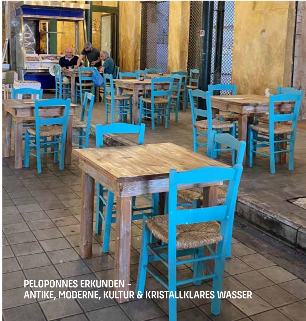
PELOPONNES ERKUNDEN - ANTIKE, MODERNE, KULTUR & KRISTALLKLARES WASSER