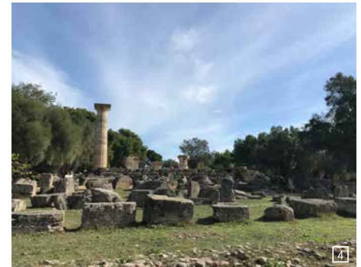
1) Athen, Blick auf die Akropolis, 2) Altstadt Athen, 3) Delphi, 4) Olympia