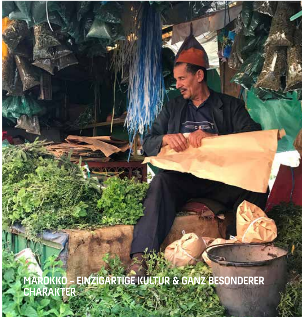
MAROKKO - EINZIGARTIGE KULTUR & GANZ BESONDERER CHARAKTER