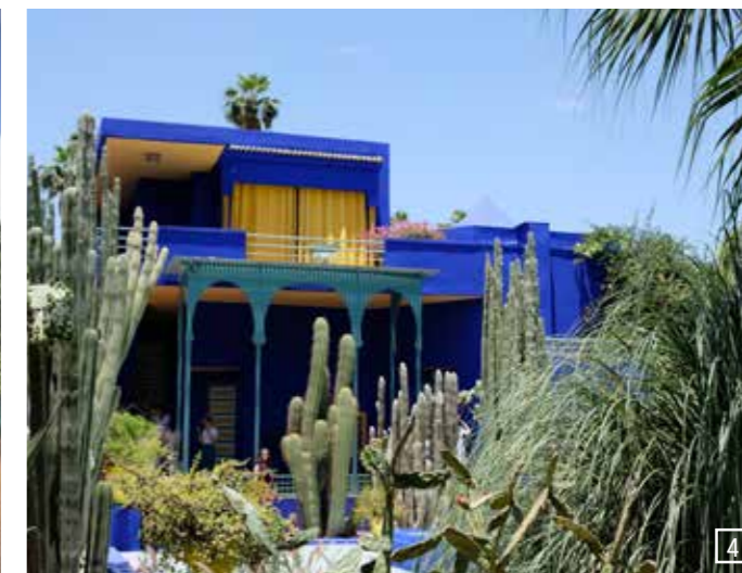
1 + 2) Anima Garten Marrakesch, 3 + 4) Jardin Majorelle