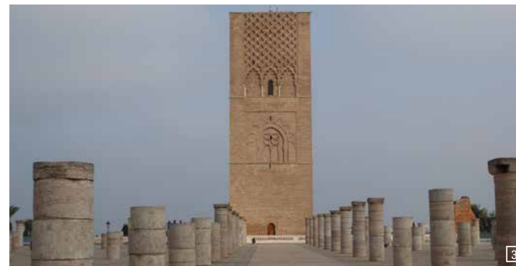
1) Casablanca Moschee, 2) Rabat vor dem Königspalast, 3) Rabat Hassan Turm