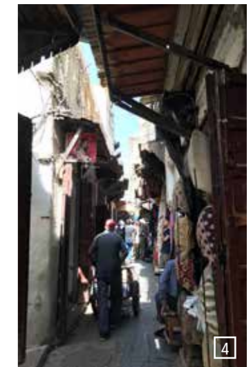
1) Volubilis, 2) Königlicher Palast in Fes, 3 + 4) In den Strassen von Fes