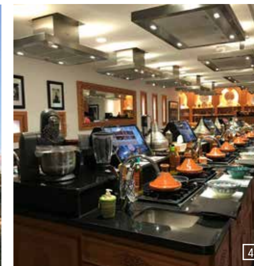
1 + 2) Marrakesch Medina, 3) La Koutoubia Moschee, 4) Kochkurs